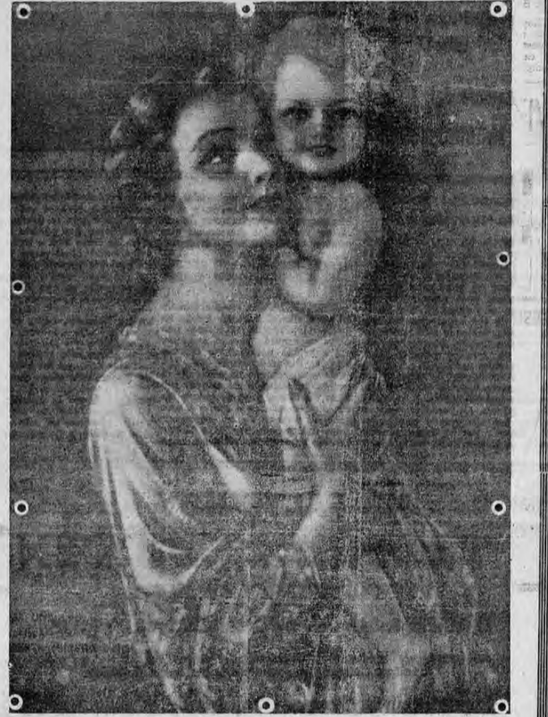
Al mismo tiempo se complace en recomendarles su reciente y notable preparado.